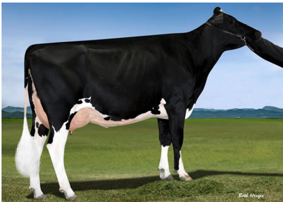
FAIRMONT TUFFENUFF RIDGE GRANDDAM